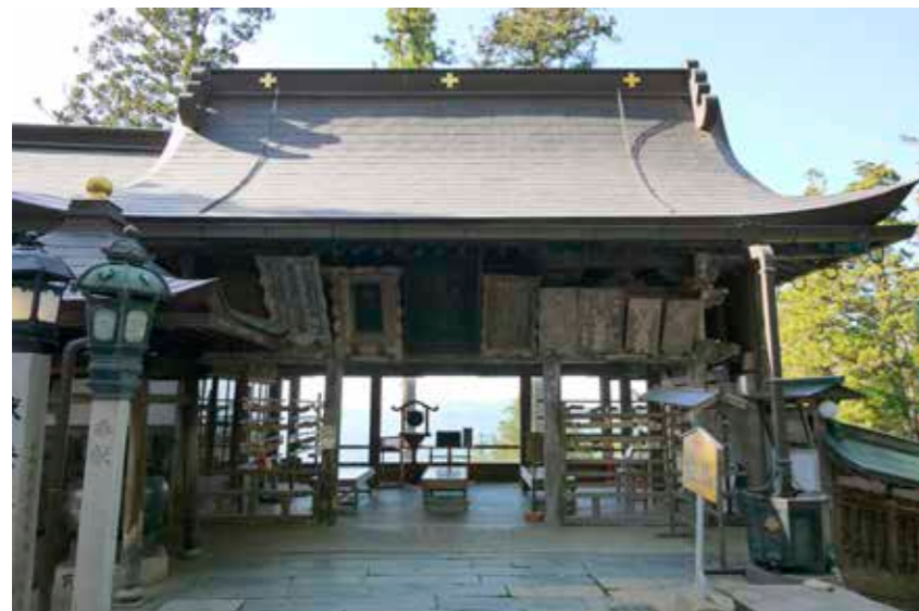
妙見山十勝に詠われた景色がよみがえり絵馬堂から北極星も