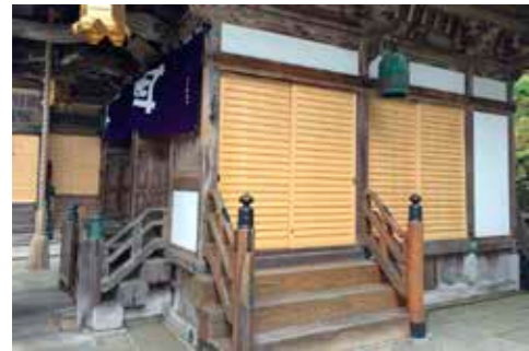
祖師堂の木がやせて隙間だらけの舞良戸(まいらど)を新調