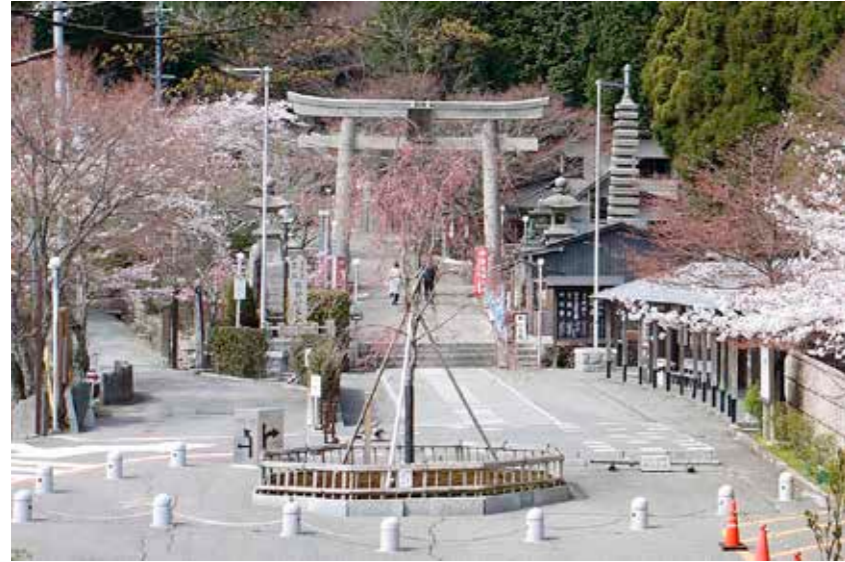
歩道が整備され正面にはシダレザクラが咲く