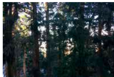
以前の絵馬堂北側