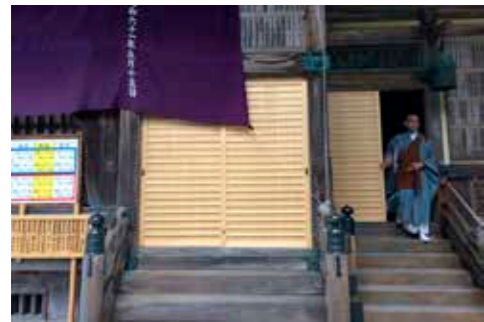
開運殿の舞良戸(まいらど)も新調